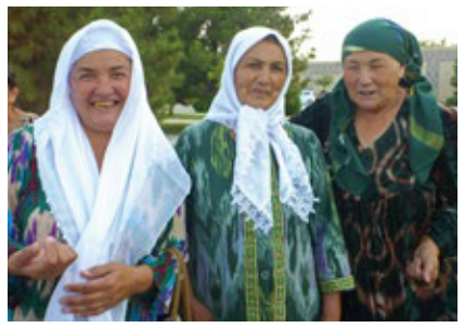
右/アトラスを織るウズベキスタンの女性 左/天然色素で染めた時代のアトラス 右下/様々な色柄のスザニ

女性は、アトラスやアドラスでできたワンピースやズボン、帽子を着用します。眉毛を一本に繋げる化粧をし、細い三つ編みを何本も垂らす伝統的なファッションは、都会では最近なかなか見かけられなくなりました。