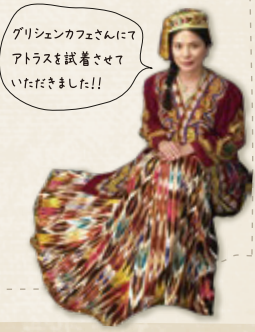
グリシエンカフェさんにアトラスを試着させていただきました!!